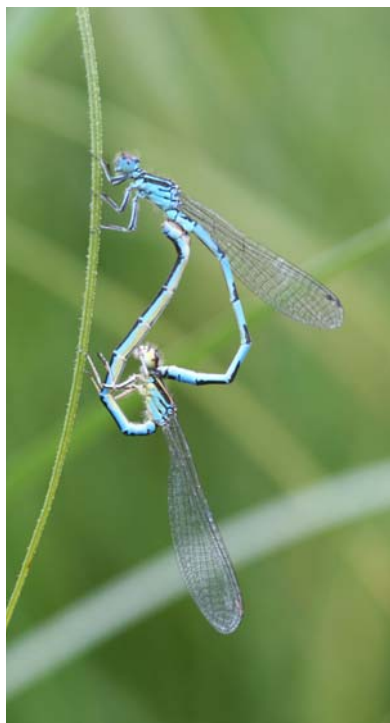
Figure 7 : Accouplement de Coenagrion mercuriale , espèce compagne de Coenagrion ornatum .

La création d'un nouveau zonage Natura 2000 a été proposé à la Diren Auvergne afin de mettre en place des mesures de protection adaptées à l'espèce.