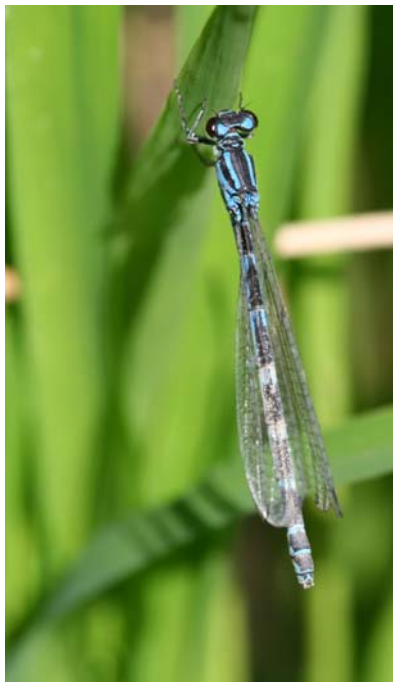
Figure 4 : Coenagrion ornatum femelle

du mois de mai et s'étend jusqu'à la mi-juillet.