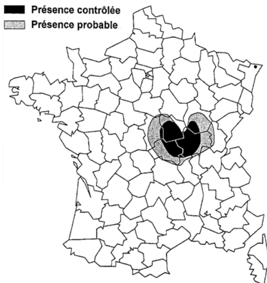
Fig.1 : Estimation de la répartition de Coenagrion ornatum en France (d'après GRAND, 1995)