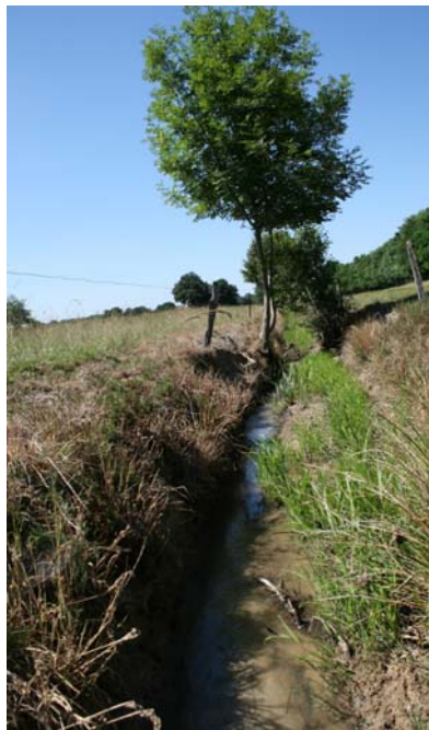
Figure 5 et 6 : Illustration des biotopes fréquentés par Coenagrion ornatum . Zone très végétalisée (figure 5) ou au contraire partie curée du ruisseau (figure 6).

La population a été découverte tardivement, le 1er juillet 2008 sur la commune de Gannay-sur-Loire.