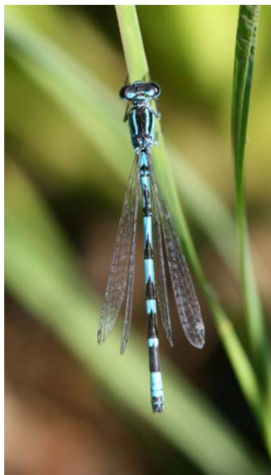
Figure 3 : Coenagrion ornatum mâle

Coenagrion ornatum se développe dans des eaux courantes de faible importance et au fond vaseux, surtout des ruisseaux et fossés dans des prés, exceptionnellement des